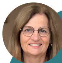
Blandine Sarrazin Maire du Barp