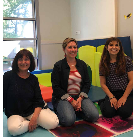
Les professionnelles du LAEP qui accueilleront les familles à partir du 9 septembre

Au programme : jeux libres et collectifs avec les enfants de petites sections, découverte de l'école, collation... Pour faciliter la découverte de ce nouvel univers, chacun d'entre eux bénéficiera de 2 temps passerelle.