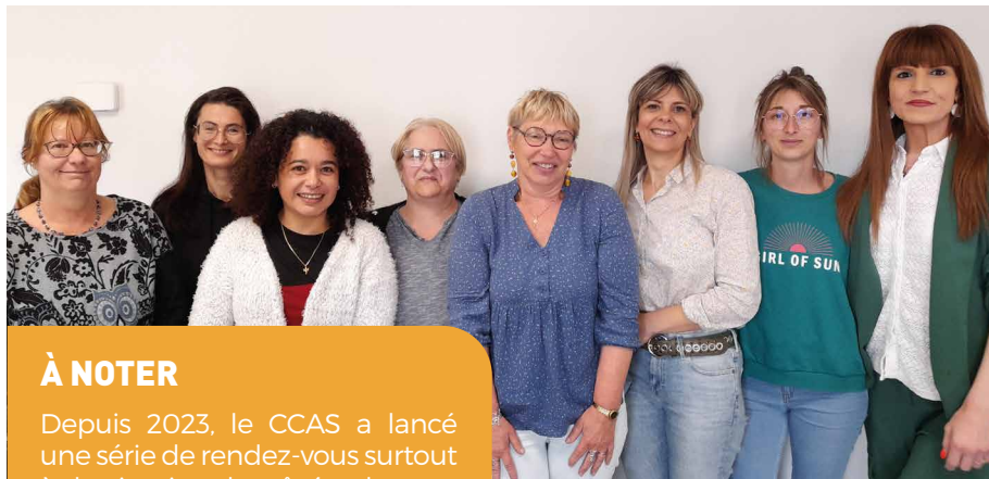
Équipe du service d'Aide à Domicile

Pour vous inscrire sur le registre communal : appelez le CCAS au 05 57 71 98 59